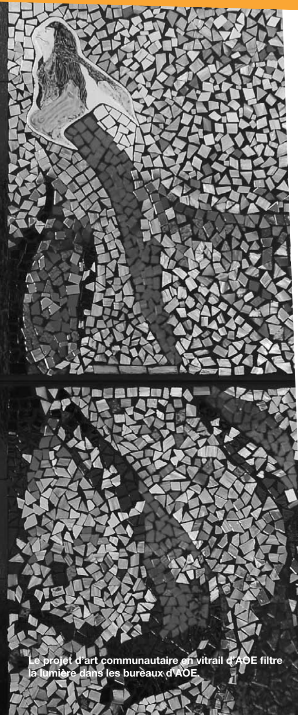
Le projet d'art communautaire en vitrail d'AOE filtre la lumière dans les bureaux d'AOE.