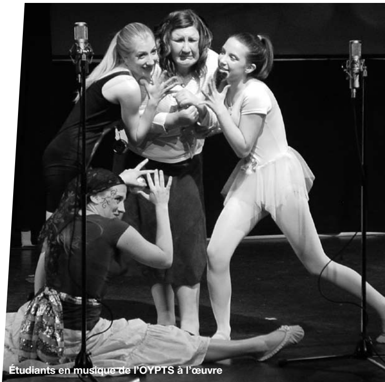
Étudiants en musique de l'OYPTS à l'œuvre

L'école de théâtre OYP est excitée et fière d'être l'un des partenaires résidents du Centre des Arts Shenkman, offrant aux étudiants un accès à un théâtre professionnel pour tous les cours, les répétitions et les spectacles. Cette année, grâce à l'aide et au soutien de MIFO, l'OYP est très fière d'offrir le premier cours de théâtre en français, qui sera suivi de nombreux autres dans l'avenir.